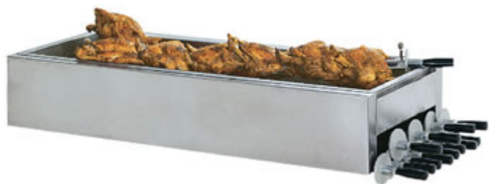
Porta spade in Acciaio Inox dim. mm 1098x480x400h