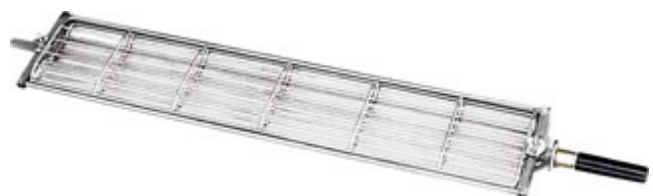
Spiedo a gabbia in Acciaio Inox