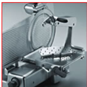
Zavorra inox smontabile

Dati tecnici e caratteristiche soggetti a cambiamenti senza preavviso