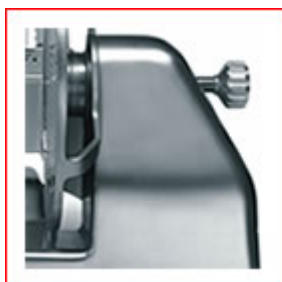
Ampio spazio tra lama e corpo macchina