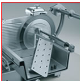
Zavorra inox smontabile

Dati tecnici e caratteristiche soggetti a cambiamenti senza preavviso