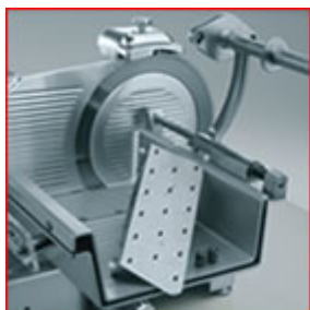
Zavorra inox smontabile

Dati tecnici e caratteristiche soggetti a cambiamenti senza preavviso