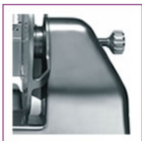
Ampio spazio tra lama e corpo macchina