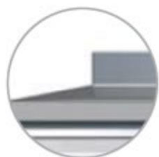
Piano con alzatina