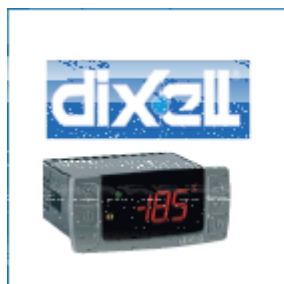
Particolare: Termostato digitale DIXELL