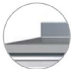
Piano con alzatina