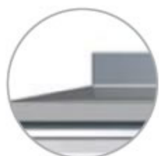
Piano con alzatina