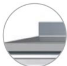
Piano con alzatina