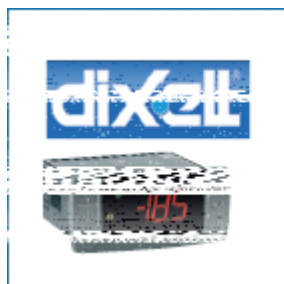
Particolare: Termostato digitale DIXELL