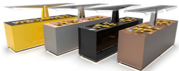
possibilità di personalizzazioni su richiesta