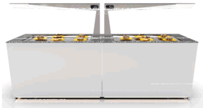
zoccolatura retroilluminata opzionale per dare un tocco ulteriore di design