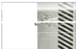
Predisposizione gas inerte di serie