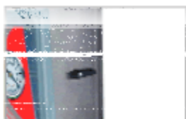
SOFTAIR: speciale dispositivo di serie per il rientro graduale della pressione dell'aria