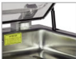
Camera inox stampata con interni arrotondati