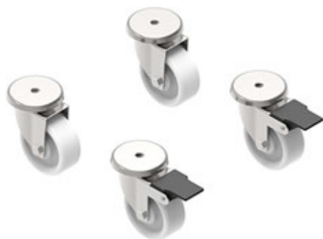
4 Ruote piroettanti di cui 2 con freno