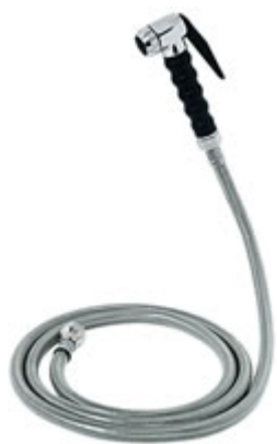
Kit doccia manuale