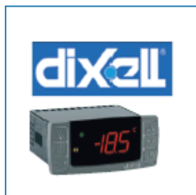
Particolare: Termostato digitale DIXELL