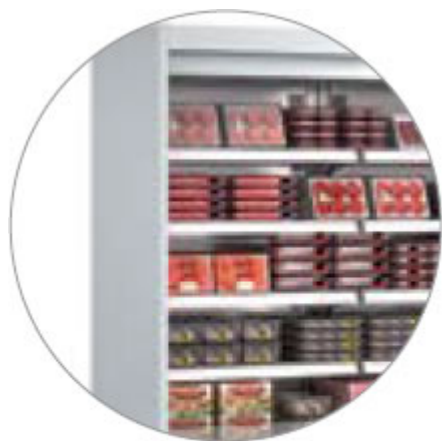
DETTAGLIO LATERALE CHIUSO (LC) SENZA SOVRAPPREZZO