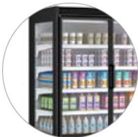
DETTAGLIO LATERALE PANORAMICO (LE)