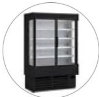
DECORAZIONE NERO DI SERIE