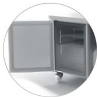
PORTE CON DOPPIA CERNIERA