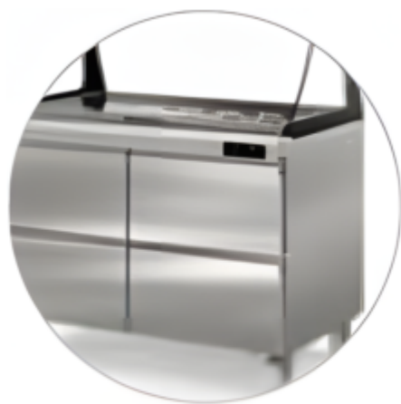
HCSAL12V CASSETTIERA OPZIONALE

Dati tecnici e caratteristiche soggetti a cambiamenti senza preavviso