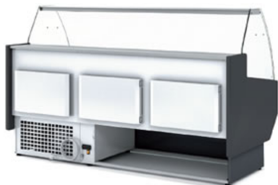
RISERVA DI SERIE NEL CASO DI 3 PORTE