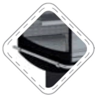
PARACOLPI LATERALI OPTIONAL