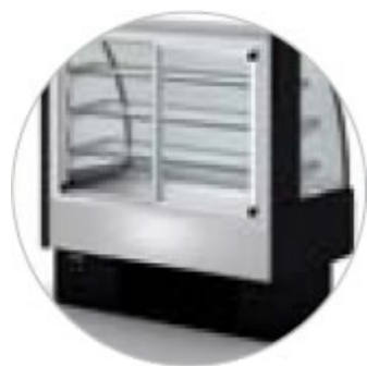
HCW613C VISTA POSTERIORE