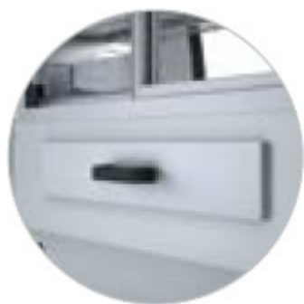
CASSETTO UMIDIFICATORE POSTERIORE