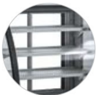
RIPIANI IN ACCIAIO REGOLABILI