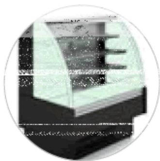
VETRI CURVI FRONTALE APERTO POSTERIORE REFRIGERATO HCVWAM6