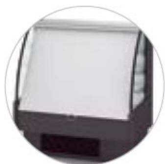
HCVWAM613C TENDINA NOTTURNA