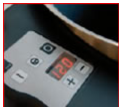
Pannello di comandi