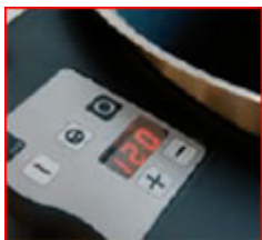
Pannello di comandi