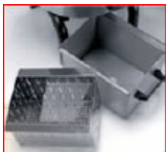
Cassetto e filtro di serie

Dati tecnici e caratteristiche soggetti a cambiamenti senza preavviso