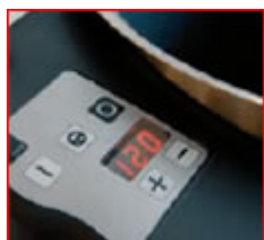
Pannello di comandi