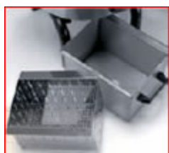
Cassetto e filtro di serie

Dati tecnici e caratteristiche soggetti a cambiamenti senza preavviso