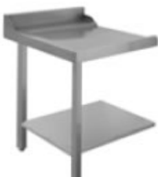
TAVOLO DI SGOMBERO SINISTRO/DESTRO