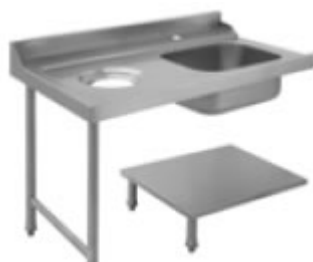
TAVOLO PRELAVAGGIO CON VASCA, ALZATINA E FORO DI SCARICO SINISTRO/DESTRO CON PIANO DI FONDO