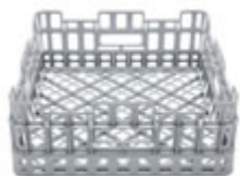
Cesto quadrato bicchieri 50x50 cm