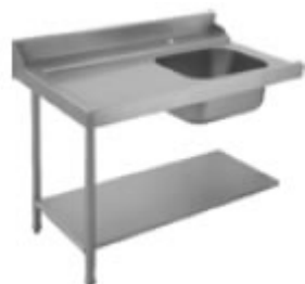
TAVOLO PRELAVAGGIO CON VASCA E ALZATINA SINISTRO/DESTRO CON PIANO DI FONDO