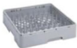
Cesto quadrato piatti 50x50 cm

Dati tecnici e caratteristiche soggetti a cambiamenti senza preavviso