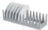
Porta piattini (13 posti)